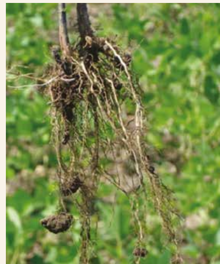
Koren soje: Visok i optimalan sadržaj azota u zemljištu

Soja, kao i ostale leguminoze (mahunarke), ima sposobnost biološkog vezivanja azota iz vazduha. To je simbiotski odnos između soje i zemljišnih bakterija, gde bakterije obezbeđuju biljci azot, a od biljke dobijaju zauzvrat različite hranljive materije. Proces fiksacije azota odvija se u posebnim organima na korenu, koji se nazivaju kvržice (nodule). Kvržice se, kao okruglaste strukture, nalaze na korenu. Proces formiranja kvržica započinje sa početnim razvojem korena, a one su aktivne tokom većeg dela razvoja i razvika biljke. Fiziološki aktivne kvržice imaju crvenkastu boju na poprečnom preseku, što je posledica prisustva pigmenta leg-hemoglobina.