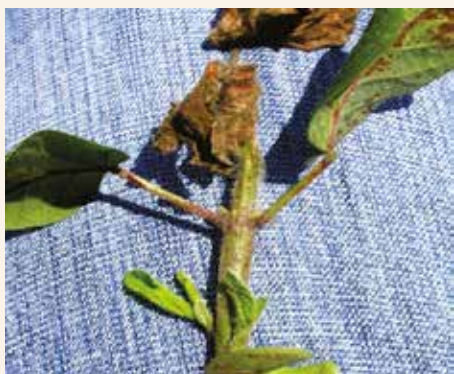
Simptomi fitotoksičnosti herbicida iz grupa imidazolinona i sulfonilurea (imazamoks i tifensulfuron-metil u uslovima temperaturnog stresa)