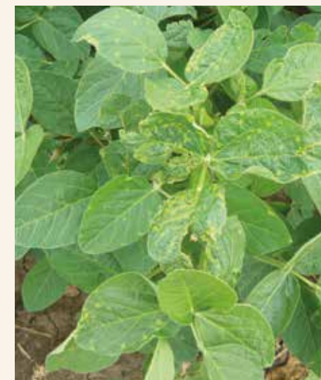
Početni simptomi bakteriozne pegavosti

Simptomi bakteriozne pegavosti se javljaju na semenu i svim nadzemnim organima soje: listu, stablu, mahunama, ali su najčešći i najizraženiji na listu. U početku su to sitne, uglaste, žute do svetlomrke pegice. Vremenom se pege znatno uvećavaju, često se međusobno spajaju formirajući velike nepravilne površine.