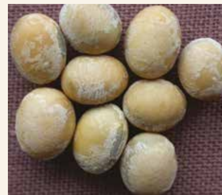
Plamenjača simptomi na semenu

Sistemično zaražene biljke su potpuno izgubljene za prinos, ali njihova procentualna zastupljenost je niska, najčešće ispod 0,1%. Velike su razlike u stepenu osetljivosti među genotipovima soje – od veoma osetljivih do potpuno otpornih. Uspešan rad na stvaranju otpornih sorti omogućuje njihovu bolju otpornost.