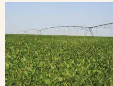
Usev soje u navodnjavanju

nalivanja zrna i prevremenog zrenja. Kad je reč o navodnjavanju soje, uz vremenske uslove potrebno je znati koja je količina vode potrebna soji u datoj fazi razvoja. Obično se sa navodnjavanjem soje započinje sa početkom cvetanja i to traje sve do kraja nalivanja zrna. Zalivni režim je potrebno uskladiti sa količinom padavina i kao najpouzdaniji pokazatelj za navodnjavanje soje pokazala se vlažnost zemljišta. Zalivni režim treba da je dovoljno fleksibilan, kako bi išao u korak sa vremenskim prilikama i obezbedio optimalnu količinu vode u kritičnim fazama razvoja soje.