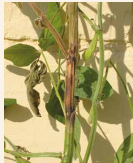
Rak stabla-simptomi na stablu

Prvi simptomi raka stabla se uočavaju nakon prelaska soje u generativnu fazu razvoja. Najintenzivnija pojava je u vreme stvaranja mahuna i nalivanja zrna.