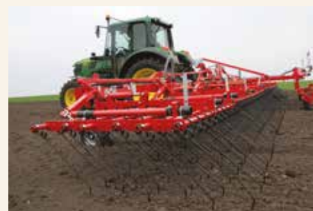
Slepa kultivacija drljačem sa opružnim zubima je veoma efikasna mera ukoliko se primeni nekoliko dana posle setve soje.

Međuredna kultivacija je veoma zastupljena mehanička mera u suzbijanju korova, koja je i veoma pogodna za razbijanje pokorice, aeraciju zemljišta, povećanje aktivnosti zemljišne mikroflore i smanjenje gubitaka zemljišne vlage. Izbor kultivatora je samo jedna komponenta efikasnog programa suzbijanja korova, a odlaganje njegove primene za nekoliko dana može značajno da umanjí efikasnost mehaničkih mera suzbijanja korova. Zbog toga je, za uspešno suzbijanje korova, vreme izvođenja zaštite kritičnije od izbora oruđa. Efikasnost mehaničkih mera u suzbijanju korova zavisi, između ostalog, od radne dubine i brzine, vlažnosti zemljišta, vrste i faze rasta korova. Previše plitka dubina rada motičica i opružnih zuba nedovoljno je efikasna mera u suzbijanju korova, dok preduboka obrada povećava rizik od oštećenja useva i podstiče na klijanje seme korova koje je izbačeno iz dubljih slojeva zemljišta. Kultivacija u uslovima vlažnog zemljišta nije efikasna u suzbijanju korova i dovodi do formiranja grudvi i sabijanja zemljišta.