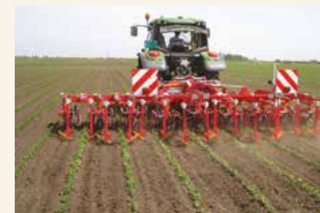
Međuredno kultiviranje je veoma zastupljen i efikasan nehemijski način suzbijanja korova.