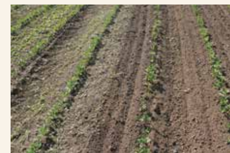
Rezultati u suzbijanju korova jednog prohoda drljače sa opružnim zubima (levo - bez obrade, desno - posle obrade)