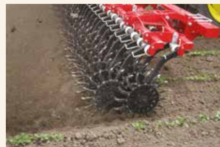
Rotaciona motika se može koristiti pri većim brzinama i ukoliko ima žetvenih ostataka koji ometaju primenu drugih mašina.