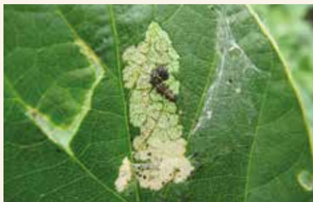
Gusenica stričkovog šarenjaka