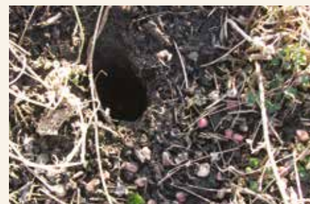
Zatrovani mamci na površini zemljišta