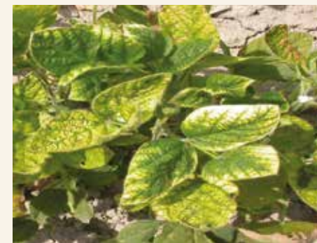
Izbeljeni listovi soje kao posledica drifta mezotriona