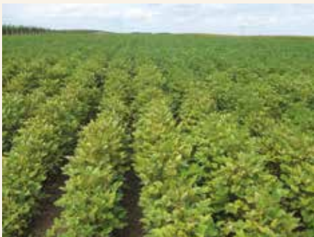
Grinje na ivicama parcele