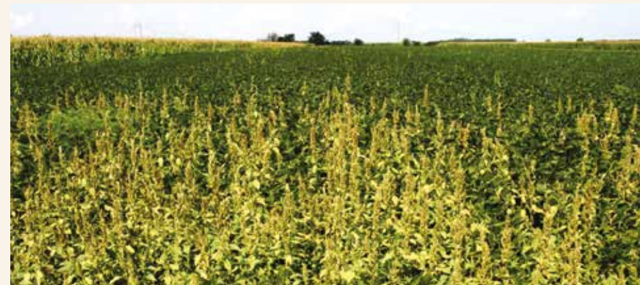
Polje soje u okolini Novog Sada zakorovljeno štikom običnim ( Amaranthus retroflexus ), kod kojeg je potvrđena rezistentnost na herbicide inhibitore ALS-aze