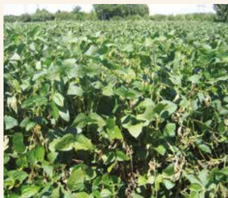
Simptomi na stablu

U nastanku i širenju bele truleži soje važna je vlažnost. Visoke temperature vazduha zaustavljaju širenje oboljenja. Intenzitet pojave bele truleži soje jači je u bujnim, gustim i jako poleglim usevima. Poznato je da nema otpornih genotipova soje, a slično je i sa ostalim biljnim vrstama