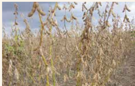
Usev soje pred žetvu

Žetvu treba započeti kada vlaga zrna opadne na 13–14%. Ako se žetva započne ranije, neophodno je sušenje. Zakasnela žetva povećava gubitke i smanjuje kvalitet zrna. Ako je usev rastao u povoljnim uslovima, listovi sa biljaka će opasti i vlaga će u roku od nekoliko dana pasti na potreban nivo. Međutim, ako je usev soje bio izložen stresnim uslovima (suša, visoka temperatura), biljke će brže prolaziti kroz razvojne faze i sazreće ranije. U takvim uslovima list uglavnom ostaje na biljkama, dok su mahune i zrna zreli. To može zavarati proizvođače i prikriti pravi trenutak za žetvu. Žetva nedovoljno zrelih useva je otežana, dok su žetveni gubici kod prezrelih useva visoki. Komercijalne sorte uglavnom imaju dobru otpornost prema pucanju mahuna, ali treba imati na umu da postoji biološki limit te otpornosti. Ako je izvesno vreme usev soje na parceli zreo i ako više puta pokisne i osuši se, stvaraju se pogodni uslovi za pucanje mahuna.