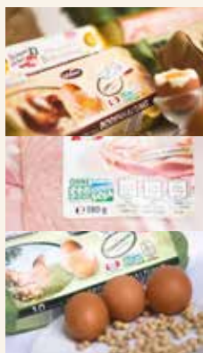
Donau Soja/Europe Soja označeni proizvodi