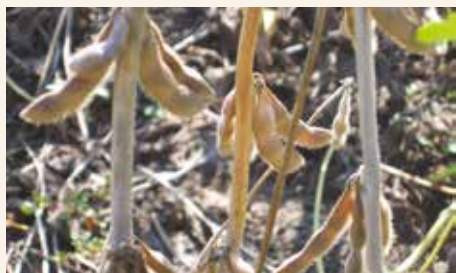
Ugljenasta nekroza korena i stabla-simptomi na stablu

Ugljenasta nekroza je tipično oboljenje korena i prizemnog dela stabla, ali se simptomi javljaju i na klijancima i mladim biljkama.