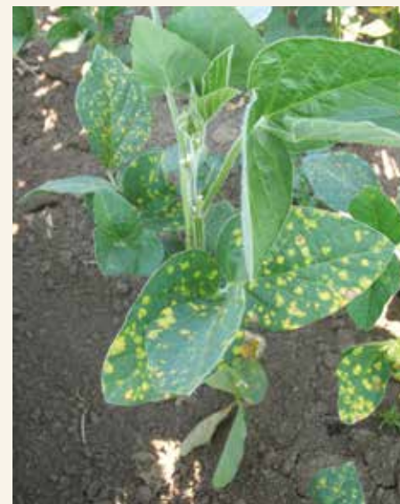
Plamenjača simptomi na listu

Plamenjača se najčešće uočava na listu i semenu soje, a može izazvati i sistemične infekcije biljaka. Sistemične infekcije nastaju na biljkama izniklim iz zaraženog semena. Prvi simptomi se uočavaju u fazi dva do tri prava lista, u vidu sitnih blede žutih pega na licu lista. U vlažnim uslovima pege se šire i međusobno spajaju zahvatajući veću površinu liske. Mahune mogu biti zahvaćene plamenjačom, ali se simptomi javljaju samo u unutrašnjosti i na semenu.