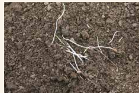
Optimalna faza belih niti korova za mehaničko suzbijanje korova