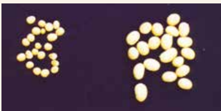
Seme oštećenih i zdravih biljaka