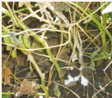
Jaka pojava bele truleži u polju

prizemnom delu, zahvaćeno tkivo stabla postaje meko, vodenasto i postepeno truli. Usled prekida protoka vode i hranljivih materija iz korena, biljke venu i u potpunosti istrule.