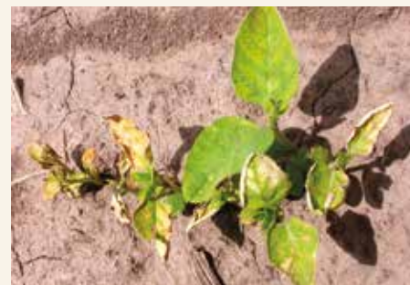
Nekroza starih listova zbog terbutilazina