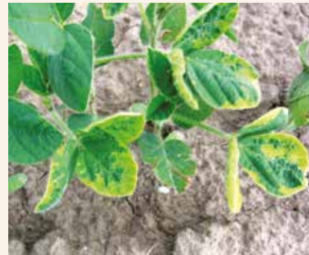
Beljenje listova posle primene preparata na bazi klomazona posle nicanja soje.