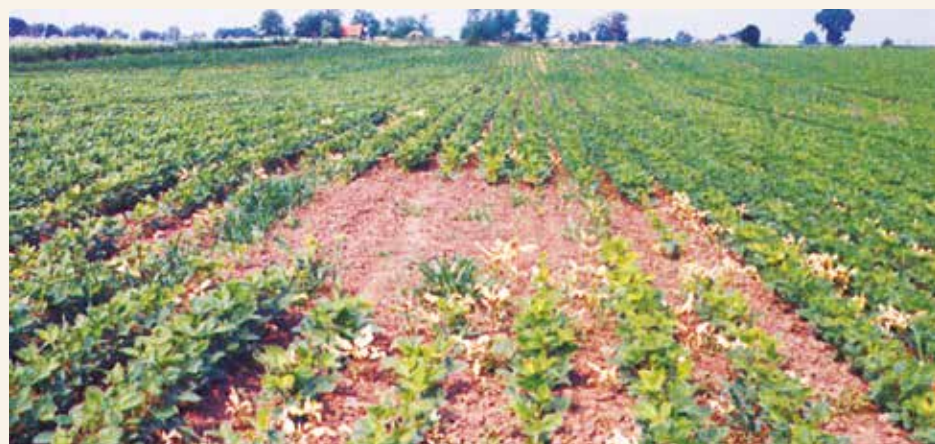
Tipična oaza u blizini jazbine hrčka