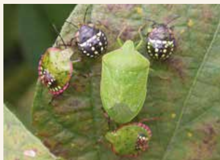
Zelena povrtna stenica – odrasli i nimfe