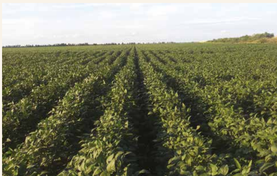
Soja kao drugi usev

što je pre moguće, i to sortama 00 i 000 grupe zrenja. Ako se setva obavi tokom juna i početkom jula, dobija se dovoljno vremena da rane sorte soje sazreju. Iako u tom periodu postoji dovoljna količina efektivnih temperatura, nedostatak vode može biti problem. Zapravo, proizvodnja soje kao drugog useva bez sistema za navodnjavanje je visokorizična. Zalivni režim za drugu setvu potrebno je izmeniti, jer tada soja zahteva manje vode (za jednu trećinu). Prvo zalivanje treba obaviti pre, odnosno posle setve, kako bi se obezbedilo ujednačeno nicanje. Svako naredno zalivanje treba usaglasiti sa potrebama soje za vodom i vremenskim uslovima. Obično je potrebno zalivanje svakih 6 do 10 dana, 5 mm za svaki dan. U slučaju da u toku ciklusa zalivanja padne više od 5 mm kiše, to je potrebno uračunati u zalivnu normu, odnosno odložiti sledeći zalivni ciklus.