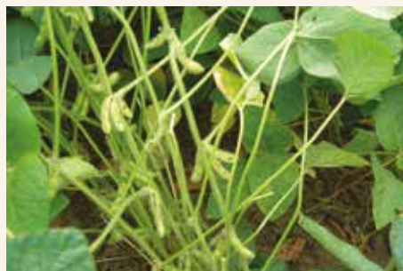
Mahune oštećene od strane pamukove sovice