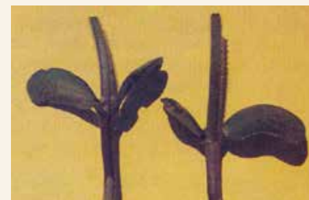
Biljke oštećene od zeca