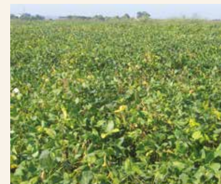
Rak stabla-prevremeno uvele biljke

Soja je najosetljivija od punog cvetanja do početka nalivanja zrna. Prema tome, ako u ovom periodu padnu obilne kiše, u usevima soje se može očekivati jača pojava raka stabla. Među komercijalnim sortama nema potpuno otpornih prema raku stabla, ali ima značajnih razlika u osetljivosti među njima. Pokazalo se da su kasnostasne sorte veoma osetljive, jer se u trenutku infekcije nalaze u ranijim fenofazama razvića. Pri ranoj infekciji dolazi do prevremenog uvenuća biljaka, koje ne donose nikakav prinos.