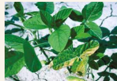
Simptomi fitotoksičnosti na starijim listovima posle primene metribuzina