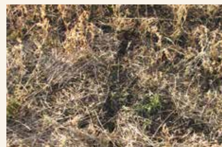
Krivudavi kanalići u blizini jazbine voluharice