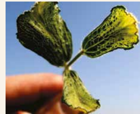
Tipični simptomi oštećenja soje posle primene herbicida regulatora rasta (drift od 2,4-D)