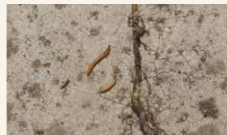
Biljka oštećena od žičara