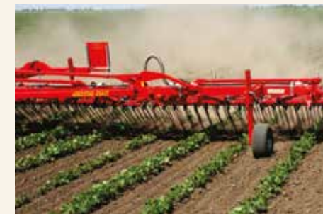
Zemljište bez žetvenih ostataka i suvo do radne dubine opružnih zuba, a korov u fazi nicanja optimalni su uslovi za upotrebu češljaste drljače.