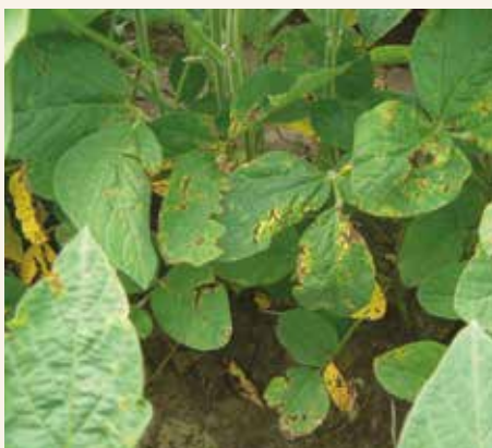
Bakteriozna pegavost-nekrotične pege na listu

Većina komercijalnih sorti soje ispoljava visok stepen osetljivosti prema bakterioznoj pegavosti, budući da je veoma virulentna rasa broj 4 dominantna na soji u svim delovima sveta. Ranostasni genotipovi su osetljiviji prema ovom oboljenju.