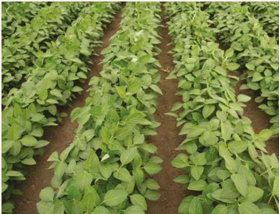
Tabela 6. Simptomi fitotoksičnosti herbicida na biljkama soje

rezervoara prskalice, da li su površine sa oštećenim biljkama u obliku uniformnih traka širine radnog zahvata prskalice, da li su uočljive razlike između različitih tipova zemljišta, da li na korovima ima simptoma itd.