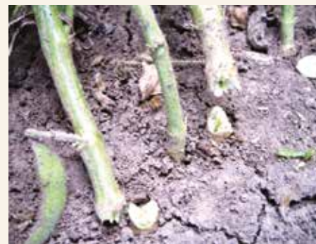
Oštećenja soje uzrokovana pendimetalinom primenjenim posle setve a pre nicanja i vlažnim i hladnim periodom neposredno nakon njegove primene.