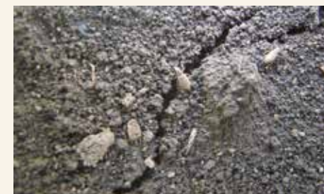
Siva kukuruzna pipa