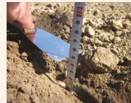
Optimalna dubina setve

Dubina setve: Dubina setve je važna kako bi se obezbedilo uniformno nicanje i optimalan sklop biljaka. Ako se poseje suviše duboko, pogotovo u hladno zemljište, klijanje semena i nicanje biljaka biće usporeno ili čak uopšte neće nići. Suviše plitka setva nosi rizik isušivanja gornjeg sloja zemljišta, što može uzrokovati zaustavljanje klijanja semena. Optimalna dubina setve je 4–5 cm, a na težim zemljištima može se posejati i malo pliće. Ako je zemljište suvo, ne treba povećavati dubinu setve. Veoma je važno da se obezbedi jednobrazna dubina setve, kako bi i nicanje bilo jednovremeno, a samim tim i sazrevanje useva.