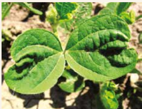
Simptomi fitotoksičnosti od herbicida iz grupe hloracetamida (dimetenamid-P posle obilnih kiša i hladnog vremena)